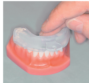
3 Impression (on the model or jaw)

Before the „impression“ is made, the inner sides and edges of BRUXI+ have to be generously sealed several times with SILCOfix.