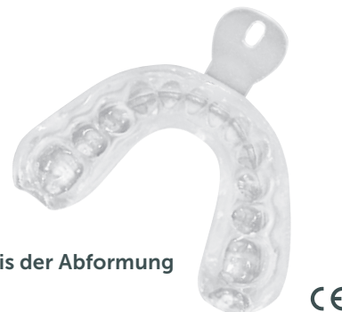
Ergebnis der Abformung

Die Aushärtezeit im Mund beträgt nur ca. 90 sec., während sie auf dem Kiefermodell ca. 3 Min. benötigt. Nach ca. 5 Min. können Überschüsse mit einer Schere abgeschnitten und eine Randglättung mit Sandpapier-Kappen vorgenommen werden.