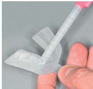
2 Fill it with the DIRECT silicone