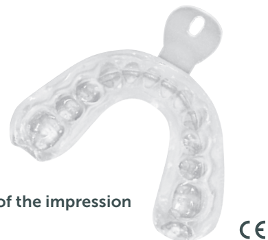
Result of the impression

It hardens in the mouth after only about 90 seconds; if the jaw model is used, it takes about 3 minutes. After approx. 5 minutes, the excess material can be cut off with scissors and the edges smoothed out with sanding discs.