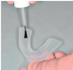
1 Seal it with SILCOfix